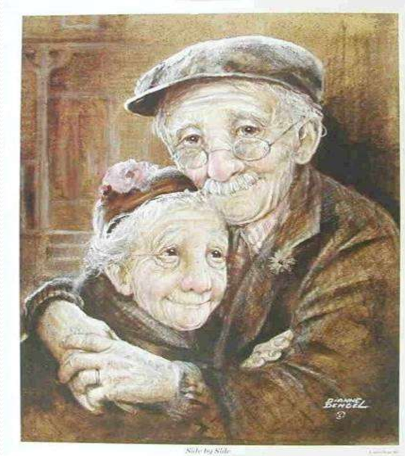
Side by Side